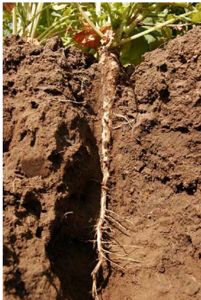
En kraftig pålrot hos vitsenap förbättrar kväveupptaget och gynnar markstruktu-ren.

Om rajgräs har odlats en lång tid kan det vara bra att bryta med senap eller oljerättika. Dessa blir inte i sig lika lätt ett ogräspro-blem i kommande grödor och är känsliga mot frost.